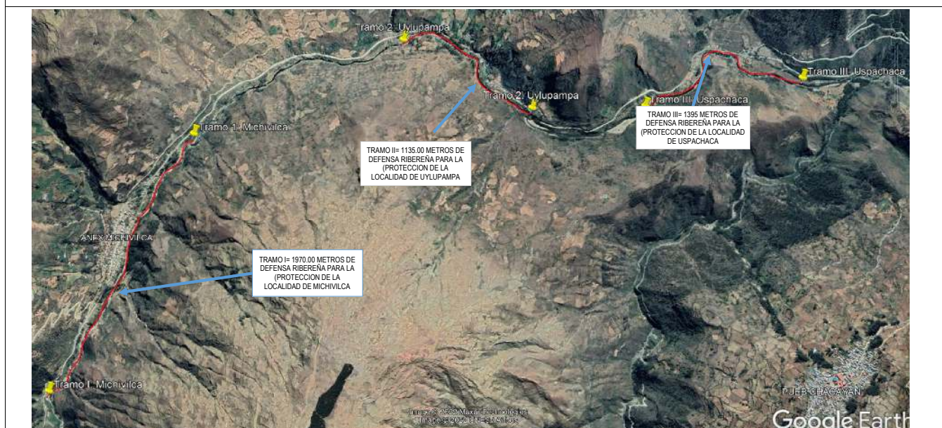
VII.- IMAGEN SATELITAL DE ZONA VULNERABLE